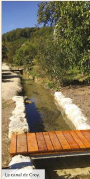
Le canal de Croy.

Divers itinéraires pédestres amènent les randonneurs par monts et par vaux, ainsi ils découvrent le site de la cascade du Dard, les fours romains et la carrière des fontaines précédemment évoquées, et la pierre gravée datant du Néolithique. Le Nozon, rivière passant sur le flanc sud du village, prend sa source à Vaulion, se partage à