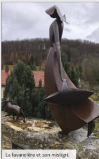
La lavandière et son mistigri.

La lavandière et son chat sont visibles en un lieu stratégique puisque, non seulement la place de la Fontaine est la plus importante du village, mais qu'en plus elle se situe sur le chemin que les ménagères empruntaient pour se rendre au lavoir.