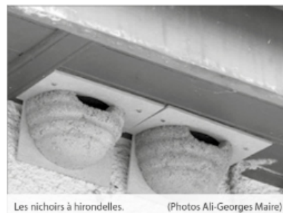
Les nichoirs à hirondelles.

Dans la plupart des communes concernées, les nichoirs sont installés sur des bâtiments communaux. A Method et Treycovagnes, où des séances d'information ont eu lieu, des privés ont proposé d'accueillir des nichoirs sur leurs bâtiments. Si la situation s'est montrée favorable pour certains, il n'en a pas été de même pour tous, provoquant du coup des regrets pour ceux qui n'ont pas vu de nichoir installé sous leur toiture. Fort de cette expérience, et pour limiter les déceptions, l'AVPN va proposer aux habitants de Chavornay une promenade instructive expliquant quels sont les lieux les plus appropriés à héberger des nichoirs. A noter qu'à Croy, un mouvement citoyen pour les oiseaux s'est formé et que là aussi des nichoirs seront posés.